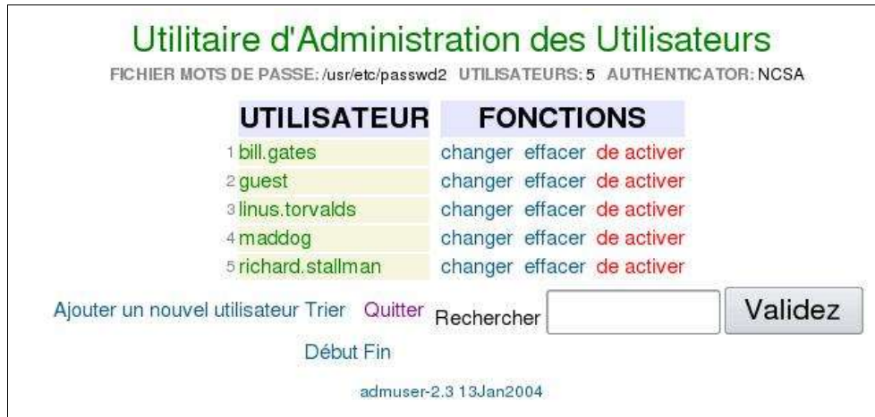
Figure 4 : Administration graphique des utilisateurs sous admuser

Pour administrer vos utilisateurs, il vous faudra simplement pointer sur l'url http://localhost/cgi-bin/admuser.cgi pour obtenir la copie d'écran qui suit. Le reste est assez intuitif.