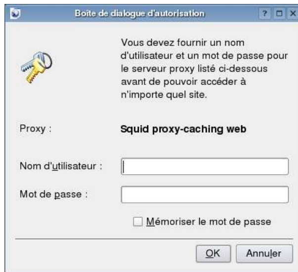
Figure 3 : Exemple d'authentification sous Konqueror

Vous trouvez que l'ajout d'un utilisateur ainsi que le changement du mot de passe n'est pas très pratique ? Nous sommes d'accord avec vous. Nous allons vous présenter deux petits utilitaires qui vont vous simplifier la vie et vaincre vos dernières réticences, en particulier dans le contexte d'une petite PME où le nombre d'utilisateurs peut être assez important.